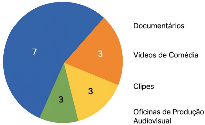
GRAFICO DO PERFIL DOS COMTEMPLADOS

Distribuição entre Empresas, Homens e Mulheres