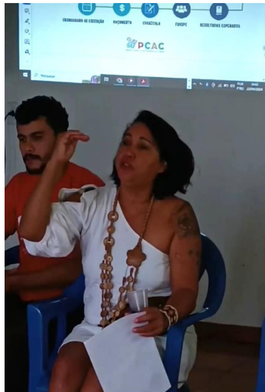
Figura 4 oitiva com os fazedores de Cultura