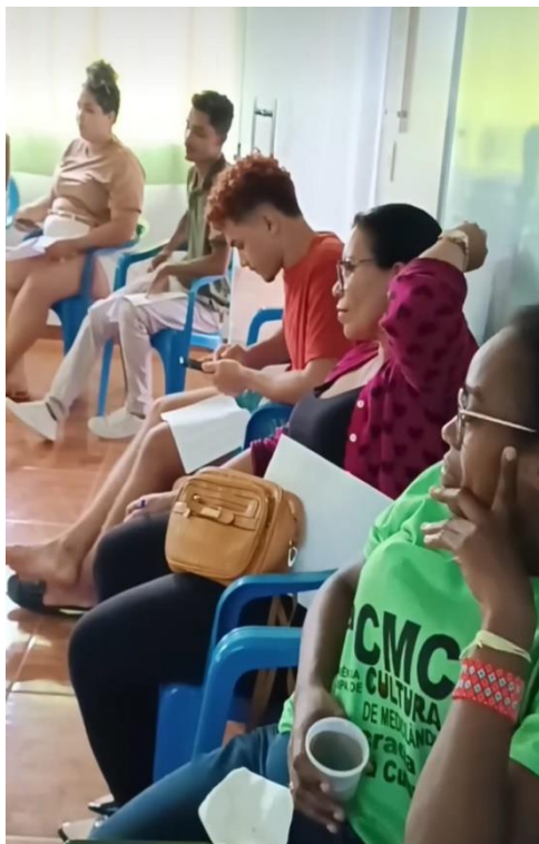
Figura 3 oitiva com os fazedores de Cultura