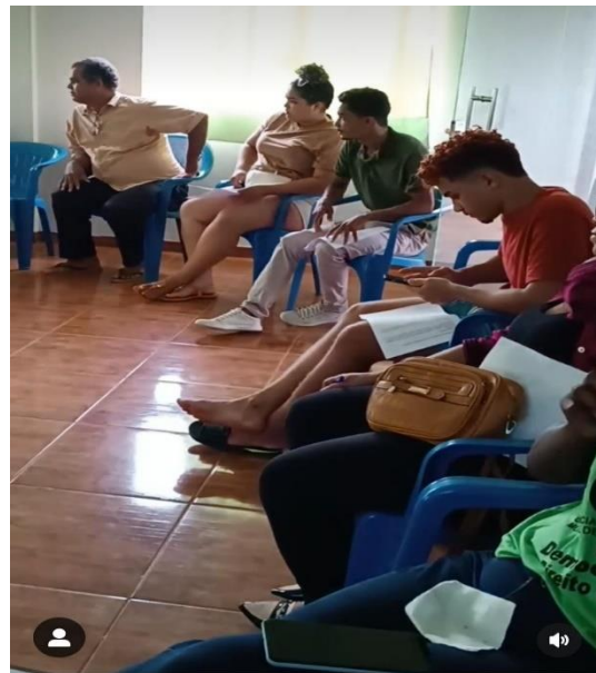
Figura 1 oitiva com os fazedores de Cultura