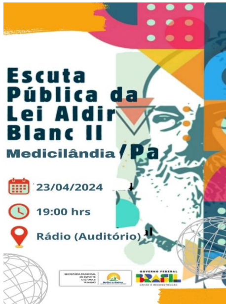
Figura 2 card de divulgação